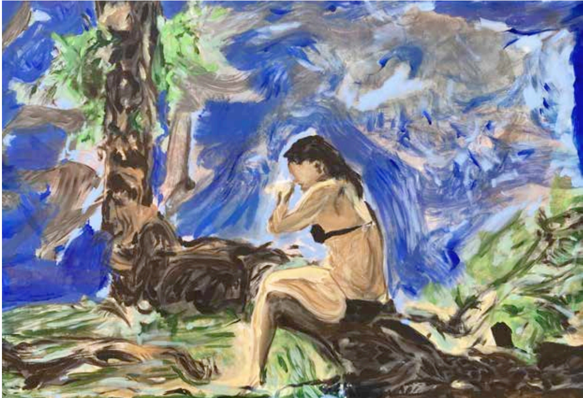
"Dreaming in Paradise II" Acrílico sobre tela, 100x70 cm. 2020 US$ 3000