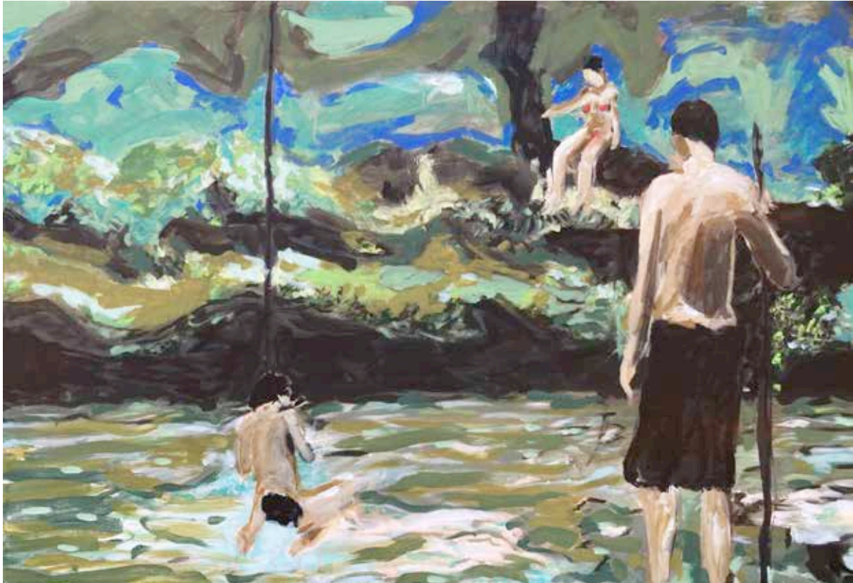
"Dreaming in Paradise" Acrílico sobre tela, 100x70 cm. 2020 US$ 3000