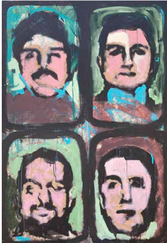
“Zoom11S” Acrílico sobre tela, 140x96 cm. 2020 US$ 4000