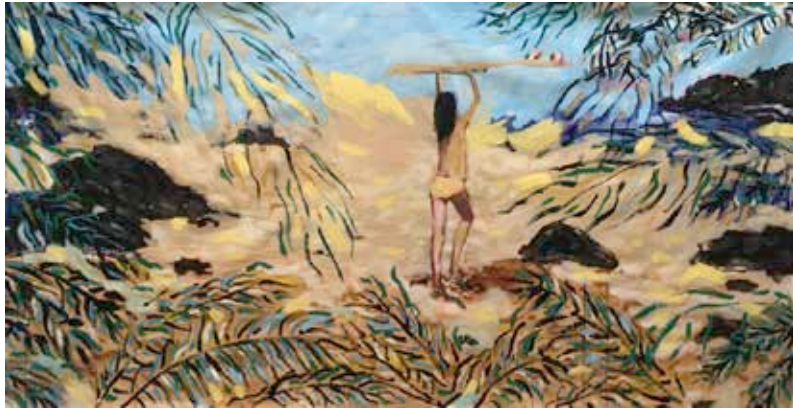
"Surfer Paradise" Acrílico sobre tela, 180x90 cm. 2020 US$ 4500